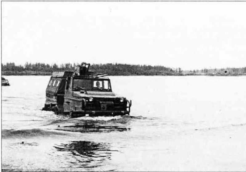
1967 Här är en Bv 202 som genomför vadning i Klubbviken i Tåme.

Här är en liten kavalkad från huvuddelen av decennierna sedan starten 1957 fram till idag 2007. Ett litet samkprov på vad som kommer att uppta hela nästa nummer av P5 bladet. Historiska återblickar, förhoppningsvis många inskickade artiklar och naturligtvis en rapport i ord och bild från firandet av jubileumet.