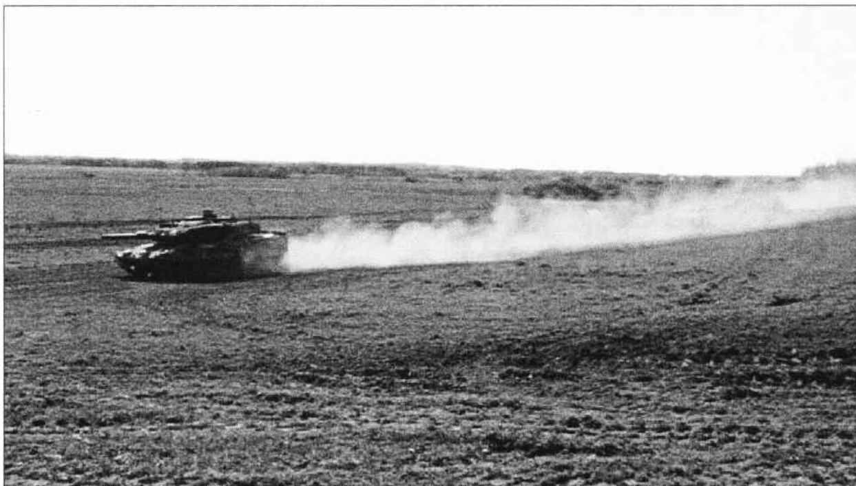
2007 En strv 122 från I 19 pansarbataljon som far fram över slätten i Skåne under övningen Combind challenge.

Kom ihåg att det DU har att berätta ÄR intressant för andra!