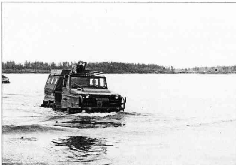
1967 Här är en Bv 202 som genomför vadning i Klubbviken i Tåme.

Här är en liten kavalkad från huvuddelen av decennierna sedan starten 1957 fram till idag 2007. Ett litet samkprov på vad som kommer att uppta hela nästa nummer av P5 bladet. Historiska återblickar, förhoppningsvis många inskickade artiklar och naturligtvis en rapport i ord och bild från firandet av jubileumet.