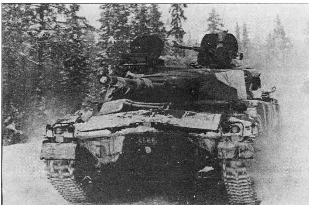
1977 Bilden är tagen vid verksamheten som genomfördes med åldersklass 77/78.

Fatta pennan, skrivmaskinen eller tangentbordet och skriv ner några rader som vi sedan kan delge alla andra. För den som så önskar returnerar vi allt inskickat material.